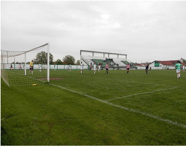
Стадион Велика Обарска

Налазе се у сеоским срединама и на њима се одигравају утакмице у организацији фудбалског савеза. Већина ових терена су у добром стању и имају пропратне садржаје (свлачионице са мокрим чворовима). Посебно треба издвојити фудбалске терене који се налазе у сеоским срединама, Јањи, Дворовима, Броцу, Великој Обарској и који имају одличну инфраструктуру, трибине, свлачионице, помоћне терене.