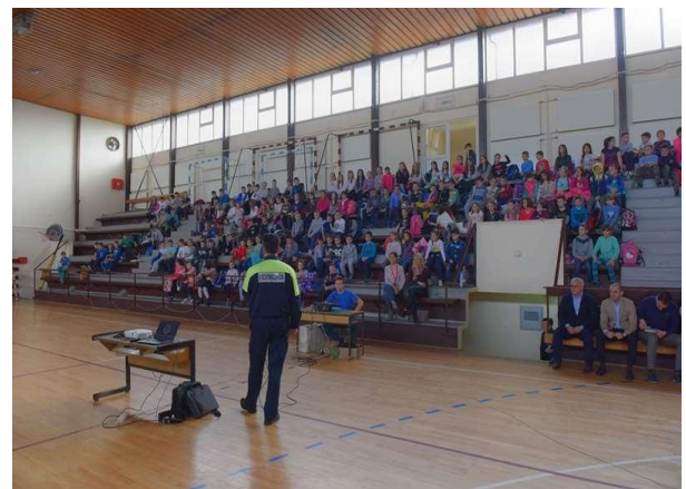
Спортска сала ОШ „Кнез Иво од Семберије“