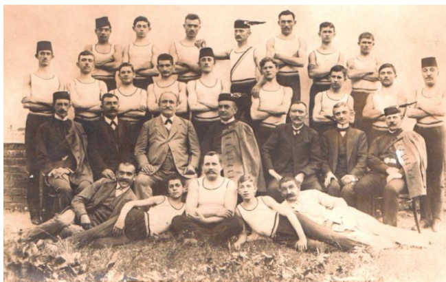
Бијељински соколи 1911. године

Почеци организованог бављења спортом у Бијељини се везују за 1908. годину и оснивање гимнастичког друштва Српски соко под називом „Обилић“ које је било дио свесловенског соколског покрета. У „Обилић“ је била укључена скоро сва српска омладина из града и убрзо је Друштво бројало преко 250 чланова. Соколари су вјежбали трчање, рвање, бацање кугле, дизање терета, бацање копља, изводили су вјежбе на справама – разбоју, вратилу, коњу с хватаљкама итд. Исте године основан је и Муслимански соко који је, поред спортских, имао и хорску и тамбурашку секцију, а ускоро је основан и Хрватски соко.