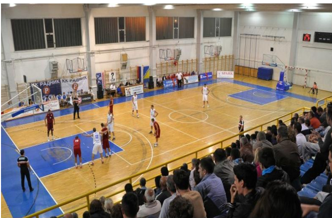
Спортска сала ОШ „Вук Караџић“

Велики број сала је реконструисан у последњих неколико година и у њима ученици имају оптималне услове за бављење спортом и спровођењем часова физичке културе.