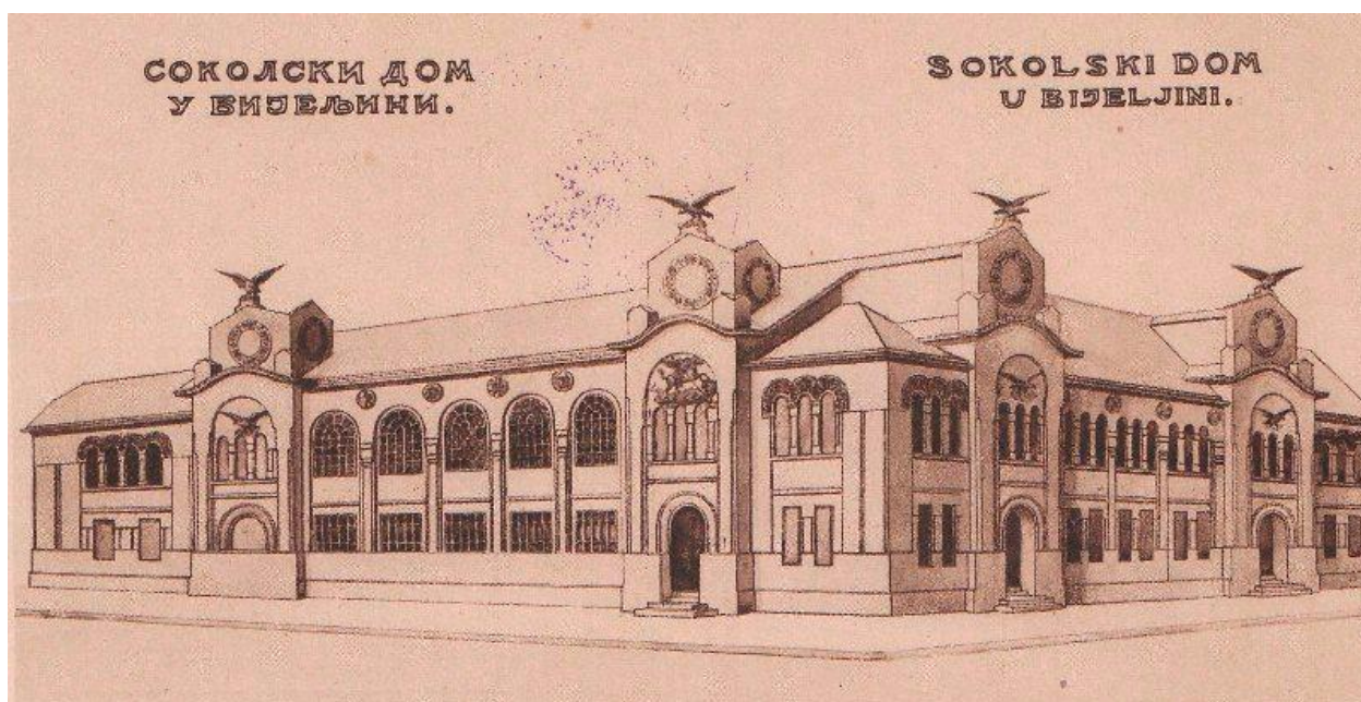
Соколски дом (1932)

У Бијељини је 1929. године, захваљујући залагању угледних Бијељинаца почела изградња Соколског дома који је завршен почетком 1932. године и одмах постао једна од најрепрезентативнијих грађевина у граду.