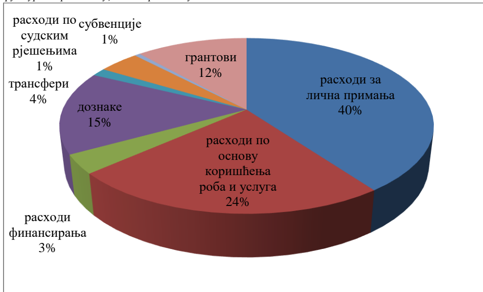
Графикон 3.-Структура извршених буџетских расхода у 2019. години

Текући расходи (група конта 410) извршени су у износу 35.531.973,00 КМ.