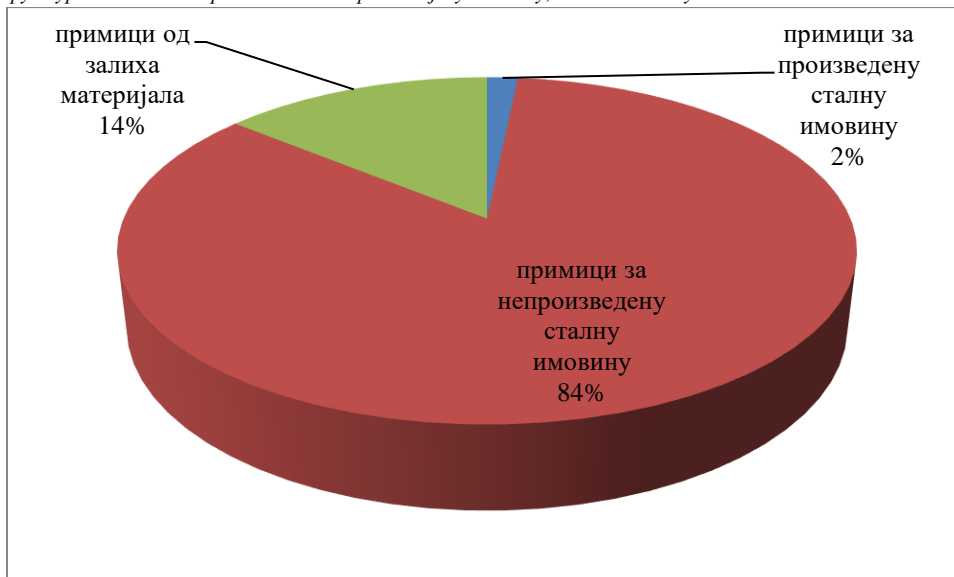
Графикон 2.-Структура наплаћених примитака за нефинансијску имовину, за 2019. годину

Структуру примитака за нефинансијску имовину чине: примици за произведену сталну имовину, примици за непроизведену сталну имовину и примици од залиха материјала, учинака, робе и ситног инвентара.