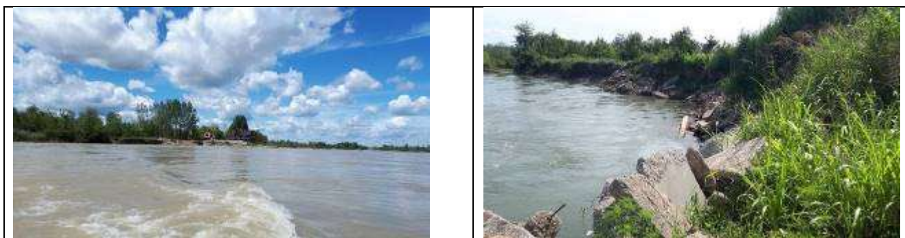
Slika 5, Postojeće stanje na lokalitetu Popovi 2

Obaloutvrda Popovi 2 – je planirana uzvodno od objekata vikendica duž starače Drine u ukupnoj dužini od cca 440 m.