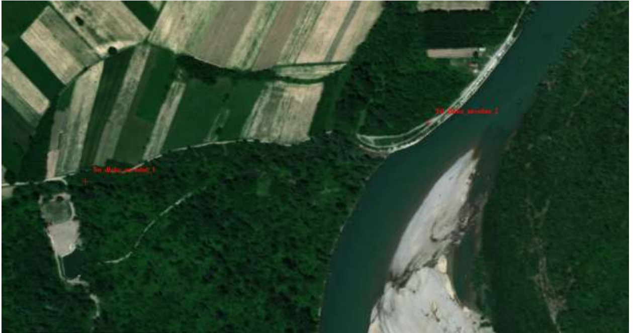
Slika 12, Početna i završna pozicija obaloutvrde „Tri dlake-uzvodno“

Obaloutvrda „Tri dlake-uzvodno“ – je planirana uzvodno od postojeće obaloutvrde koja je djelimično destabilizovana. Potrebno je uraditi i rekonstrukciju postojeće obaloutvrde u dužini od cca 200 m, tako da je ukupna dužina obaloutvrde na ovom potezu oko 580 m.