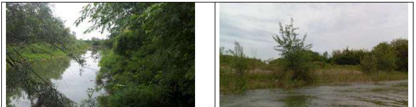
Slika 8, Postojeće stanje na lokalitetu Popovi-Amajlije

Obaloutvrda Popovi-Amajlije – je planirana s ciljem osiguranja aktivnog rukavca rijeke Drine na potezu Amajlije-Popovi u ukupnoj dužini od oko 1500 m.