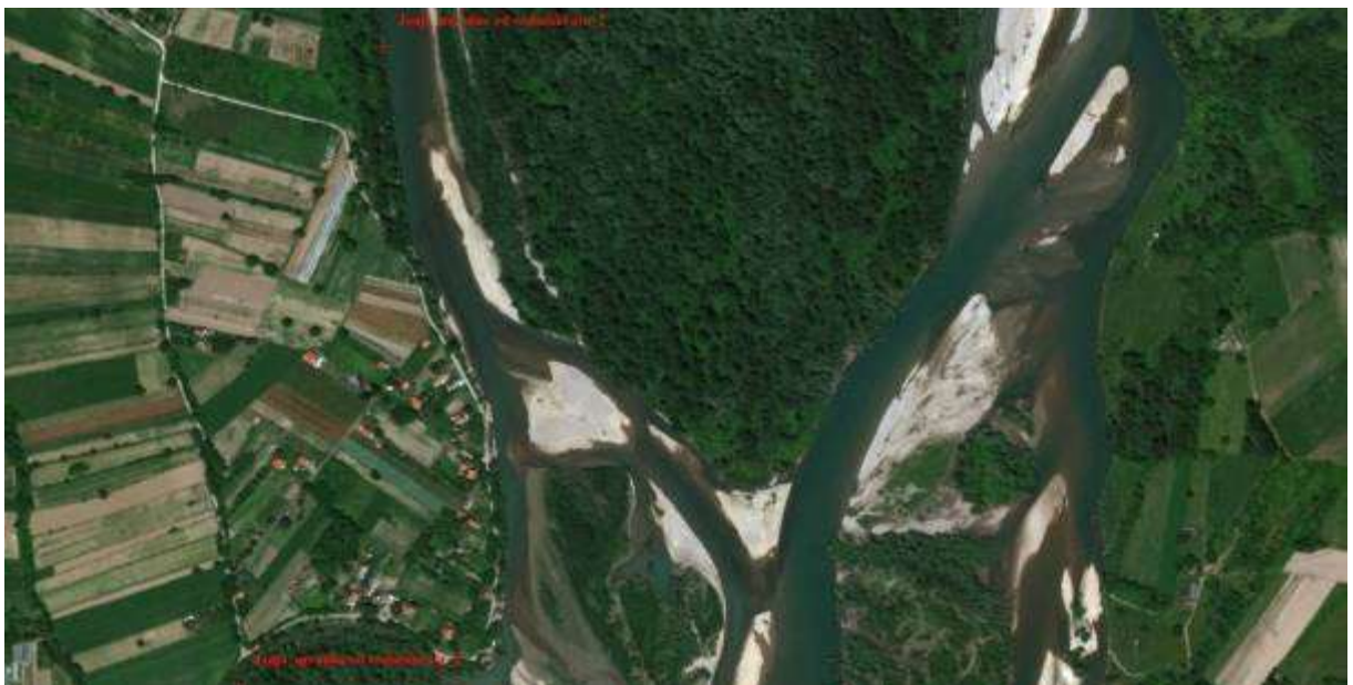
Slika 16, Početna i završna pozicija obaloutvrde „Janja-uzvodno od vodozahvata“