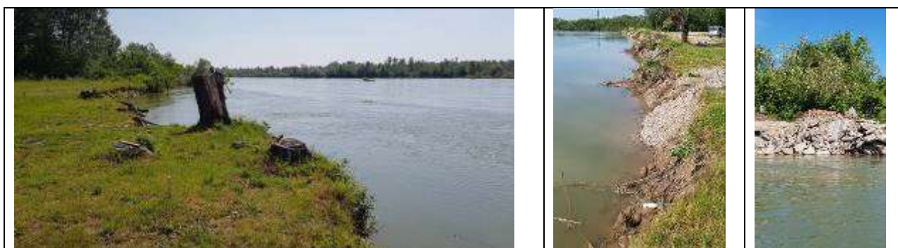
Slika 10, Postojeće stanje na lokalitetu Eko-kamp Amajlije

Obaloutvrda Eko-kamp Amajlije – je planirana na širem području Eko kampa u ukupnoj dužini od oko 630 m. Potrebno je izvesti i napore uzvodno od obaloutvrde za usmjeravanje matice velikih voda.