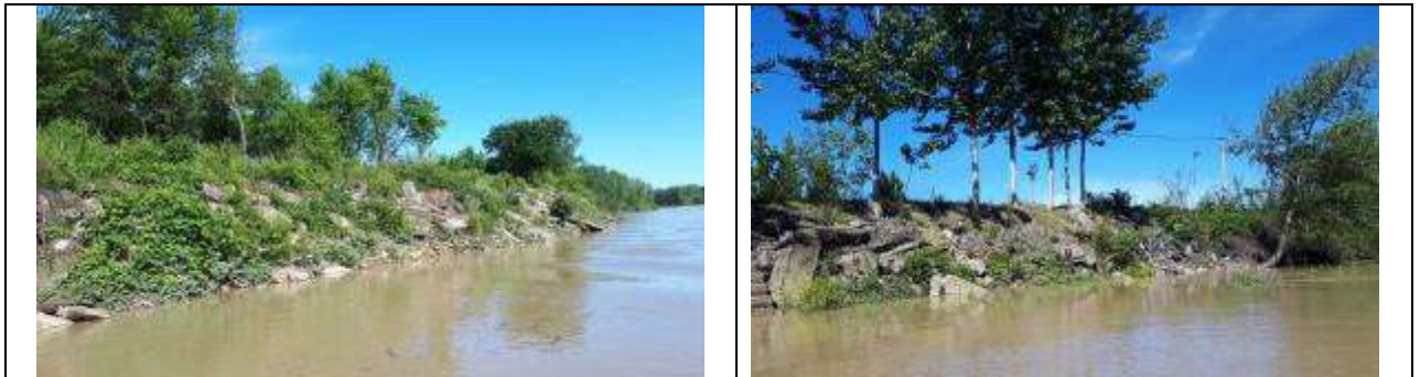
Slika 15, Postojeće stanje na lokalitetu Janja - uzvodno od vodozahvata

Obaloutvrda Janja - uzvodno od vodozahvata – na ovom potezu je planirana rekonstrukcija postojeće obaloutvrde, uz izgradnju nove obaloutvrde na pojedinim dionicama na 20% ukupne dužine, tj. 220m. Ukupna dužina obaloutvrde računajući i dijelovi koji su predviđeni za rekonstrukciju iznosi cca 1100 km.