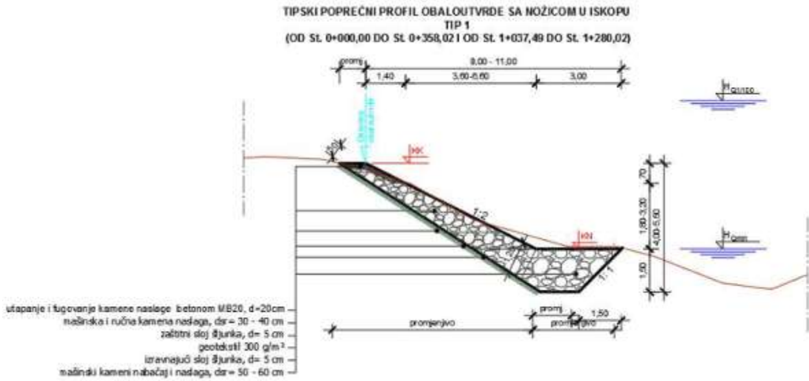
Slika 22, Tipski poprečni profil obaloutvrde sa nožicom formiranom u iskopu