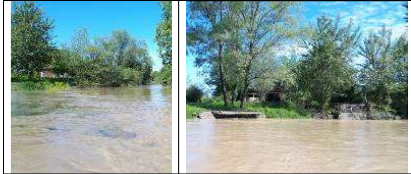
Slika 17, Postojeće stanje na lokalitetu Janja - nizvodno od ušća Janje u Drinu

Obaloutvrda Janja-nizvodno od ušća Janje u Drinu – na ovom potezu je planirana izgradnja obaloutvrde nizvodno od ušća rijeke Janje u rijeku Drinu planirana u ukupnoj dužini od cca 330 m.