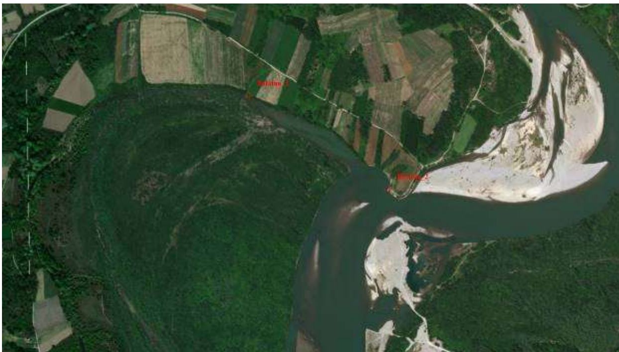
Slika 2, Početna i završna pozicija obaloutvrde Balatun