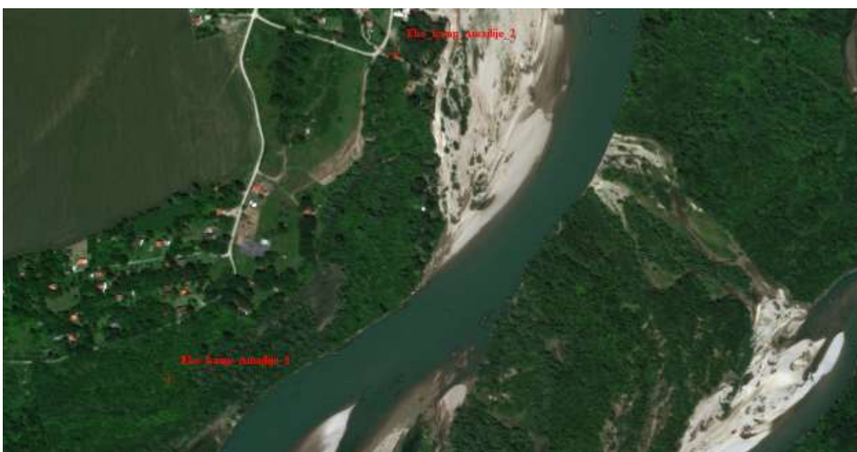
Slika 11, Početna i završna pozicija obaloutvrde Eko-kamp Amajlije