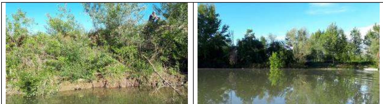
Slika 1, Postojeće stanje na lokalitetu Balatun

Obaloutvrda Balatun - Na ovom potezu planirana je izgradnja obaloutvrde uzvodno od ušća Selišta u Drinu u dužini od 600 m. Obaloutvrda se nastavlja na postojeću koja je trenutno oštećena i destabilizovana. Potrebno je izvesti i sistem napera uzvodno od obaloutvrde za usmjeravanje matice velikih voda.