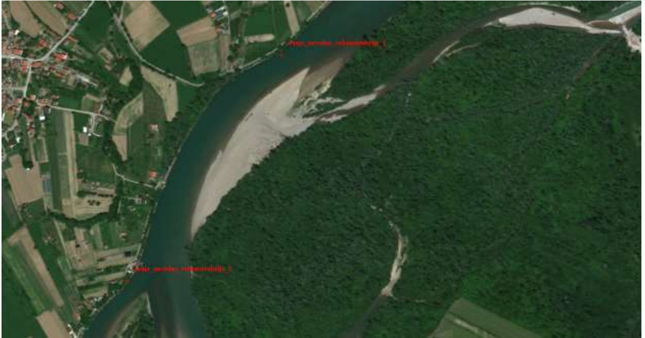
Slika 20, Početna i završna pozicija obaloutvrde „Janja-uzvodno“