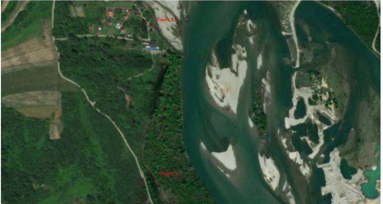
Slika 6, Početna i završna pozicija obaloutvrde Popovi 2

Obaloutvrda Popovi 3 – je planirana na osnovnom toku rijeke Drine za zaštitu parcela i vikend naselja u ukupnoj dužini od oko 770 m.