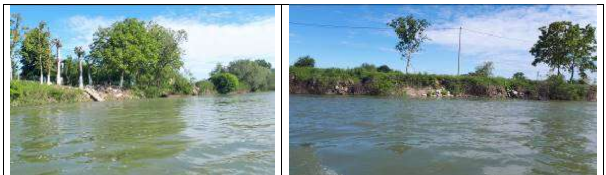
Slika 19, Postojeće stanje na lokalitetu Janja - uzvodno

Obaloutvrda Janja-uzvodno – na ovom potezu je planirana rekonstrukcija postojeće obaloutvrde u Janji u ukupnoj dužini od cca 690 m.