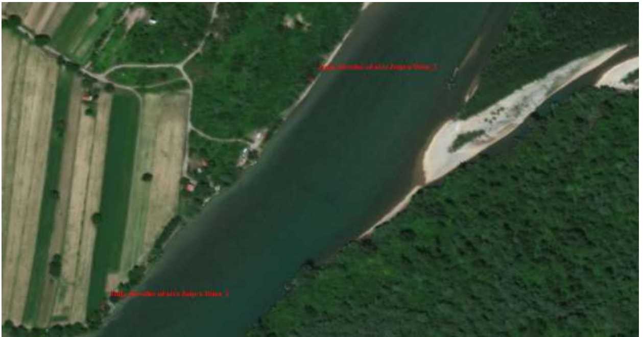
Slika 18, Početna i završna pozicija obaloutvrde „Janja-nizvodno od ušća Janje u Drinu“