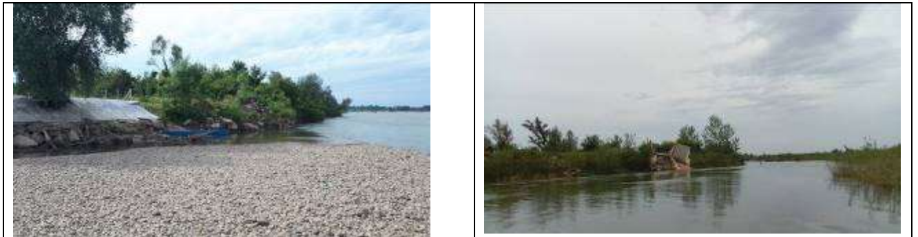
Slika 7, Postojeće stanje na lokalitetu Popovi 3

Obaloutvrda Popovi 3 – je planirana na osnovnom toku rijeke Drine za zaštitu parcela i vikend naselja u ukupnoj dužini od oko 770 m.