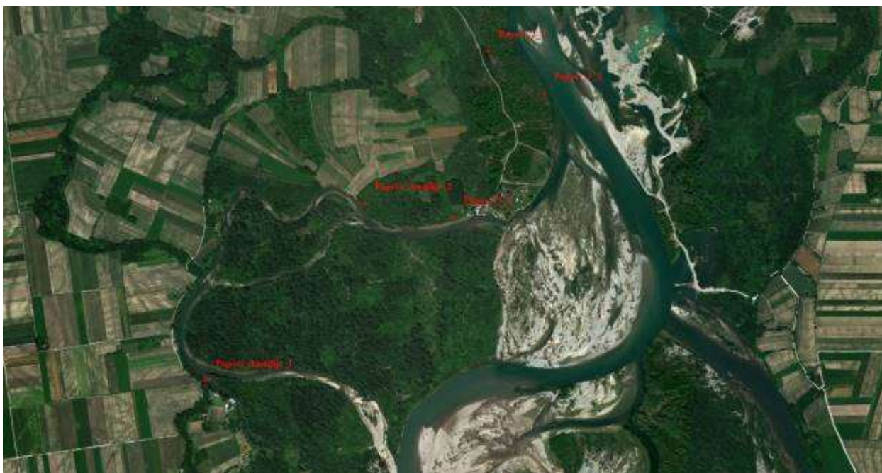
Slika 9, Početne i završne pozicije obaloutvrda Popovi 3 i Popovi-Amajlije

Obaloutvrda Eko-kamp Amajlije – je planirana na širem području Eko kampa u ukupnoj dužini od oko 630 m. Potrebno je izvesti i napore uzvodno od obaloutvrde za usmjeravanje matice velikih voda.