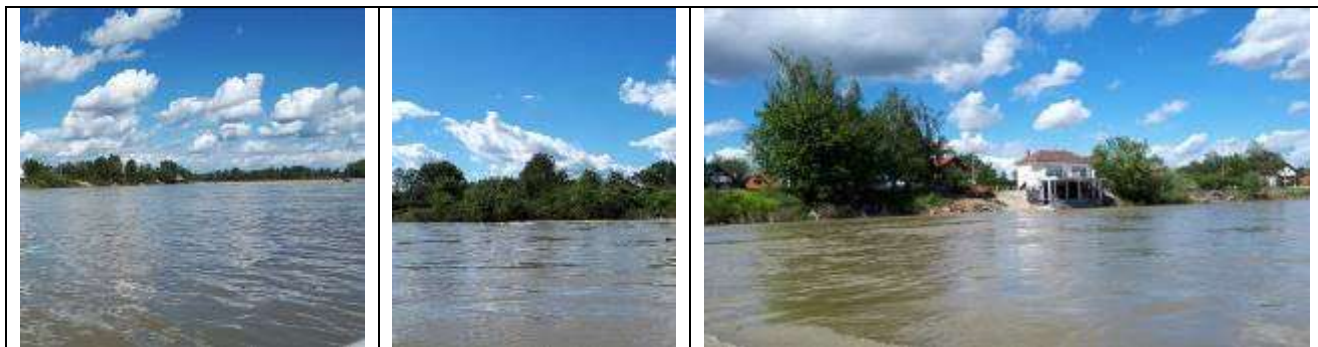
Slika 3, Postojeće stanje na lokalitetu Popovi 1