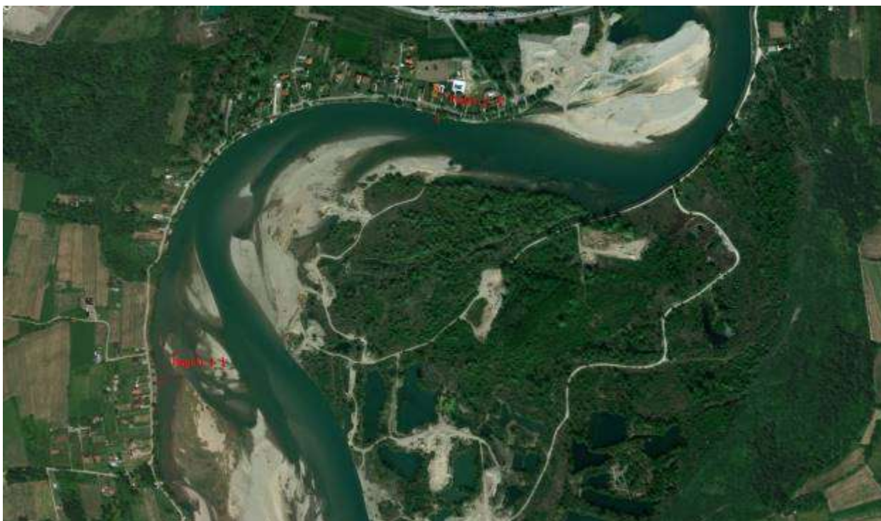
Slika 4, Početna i završna pozicija obaloutvrde Popovi 1

Obaloutvrda Popovi 2 – je planirana uzvodno od objekata vikendica duž starače Drine u ukupnoj dužini od cca 440 m.