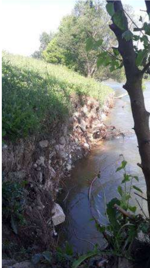
Slika 13, Postojeće stanje na lokalitetu Orlovo polje

Obaloutvrda „Orlovo polje“ – na ovom potezu je planirana rekonstrukcija postojeće obaloutvrde u ukupnoj dužini od oko 780 m.