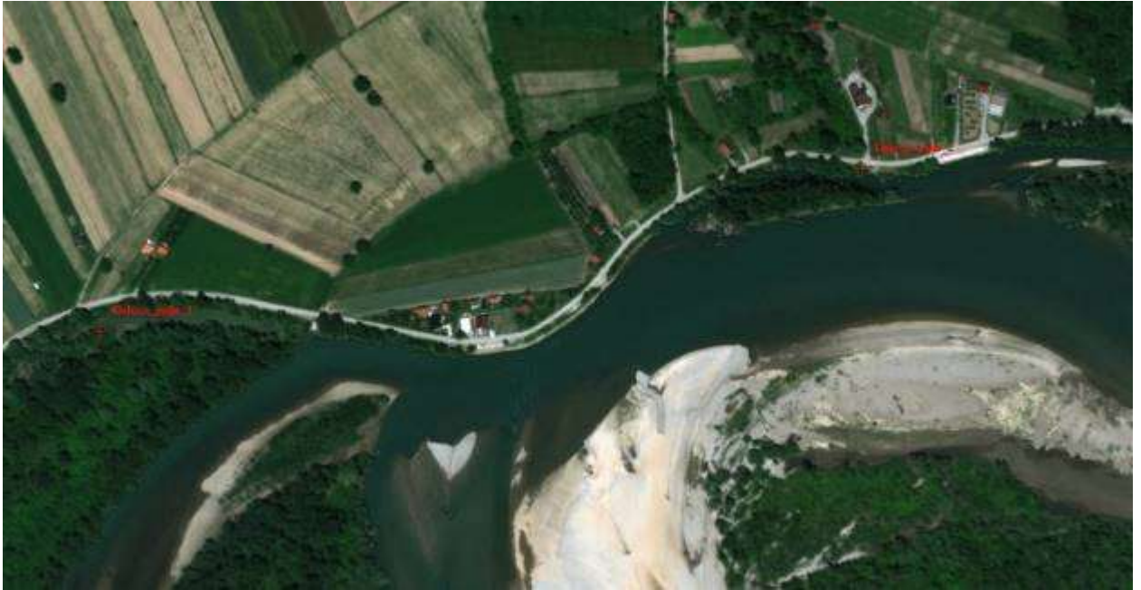
Slika 14, Početna i završna pozicija obaloutvrde „Orlovo polje“

Obaloutvrda Janja - uzvodno od vodozahvata – na ovom potezu je planirana rekonstrukcija postojeće obaloutvrde, uz izgradnju nove obaloutvrde na pojedinim dionicama na 20% ukupne dužine, tj. 220m. Ukupna dužina obaloutvrde računajući i dijelovi koji su predviđeni za rekonstrukciju iznosi cca 1100 km.